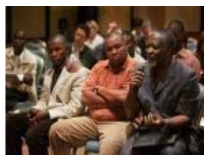
Etat des lieux de la corruption en Afrique