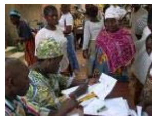
Le RCI attend les résultats de la présidentielle dans le...