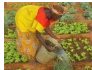
Le PAM toujours sur le pied de guerre sur la...