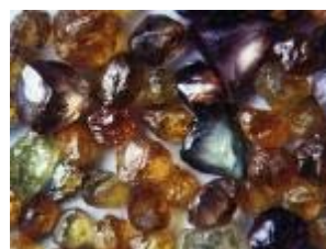
Le processus de Kimberley 2011 en RDC