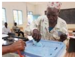
Tanzanie: Elections générales Kikwete reste favori