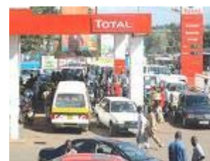
Total fait son entrée en Côte d'Ivoire